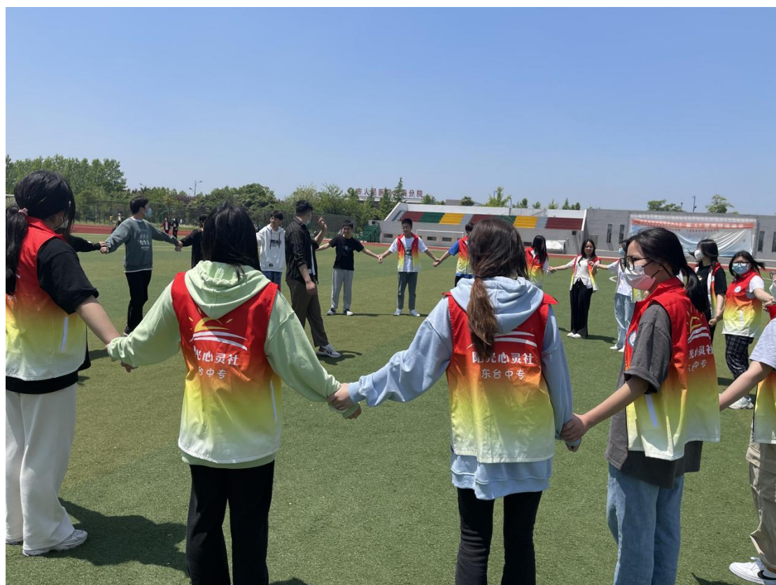
图 2 阳光心灵社学生活动

精彩的社团活动不仅丰富了学生们的课余文化生活，也为大家搭建了自我展示的平台。同学们在社团活动中感悟职业乐趣、学习优秀经验、领略职教风采！