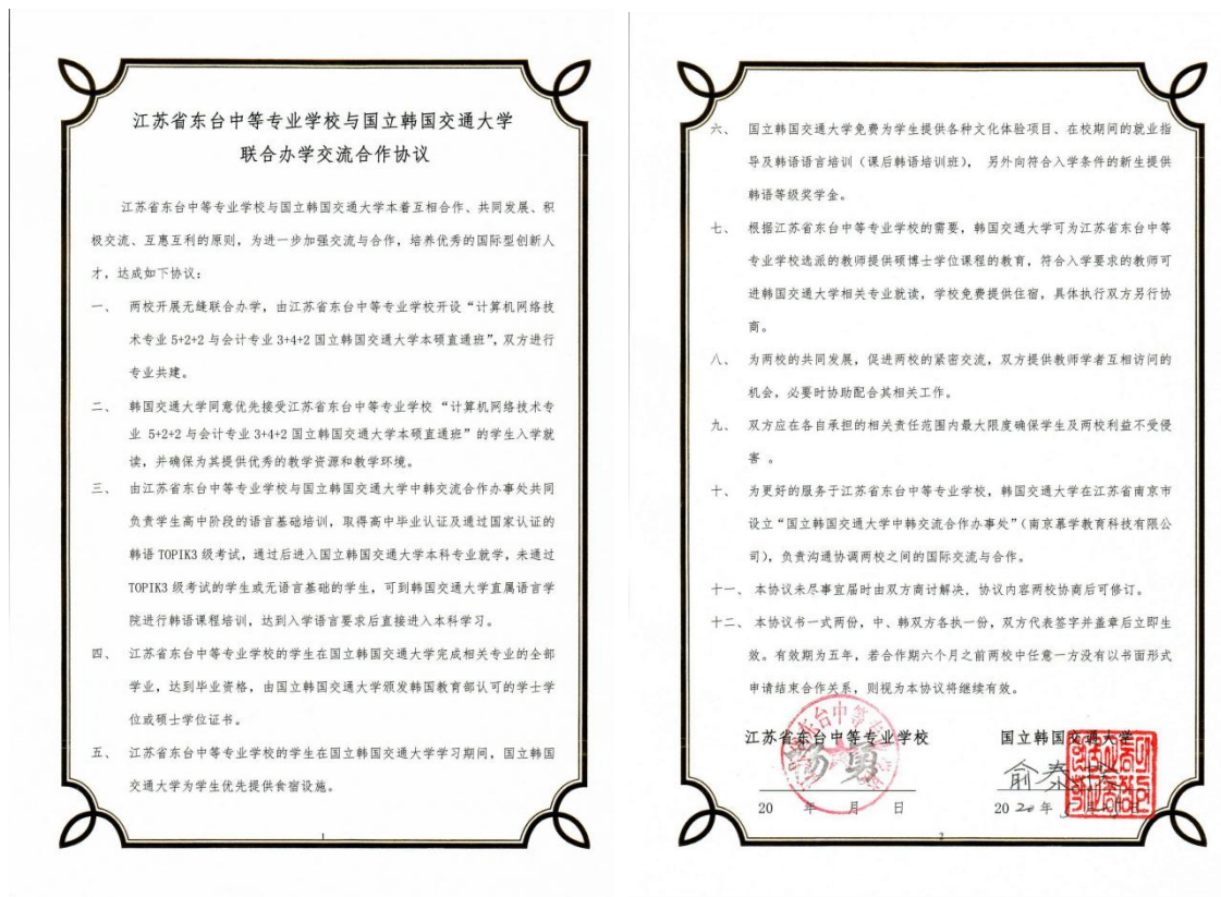
图 15 中韩联合办学协议书