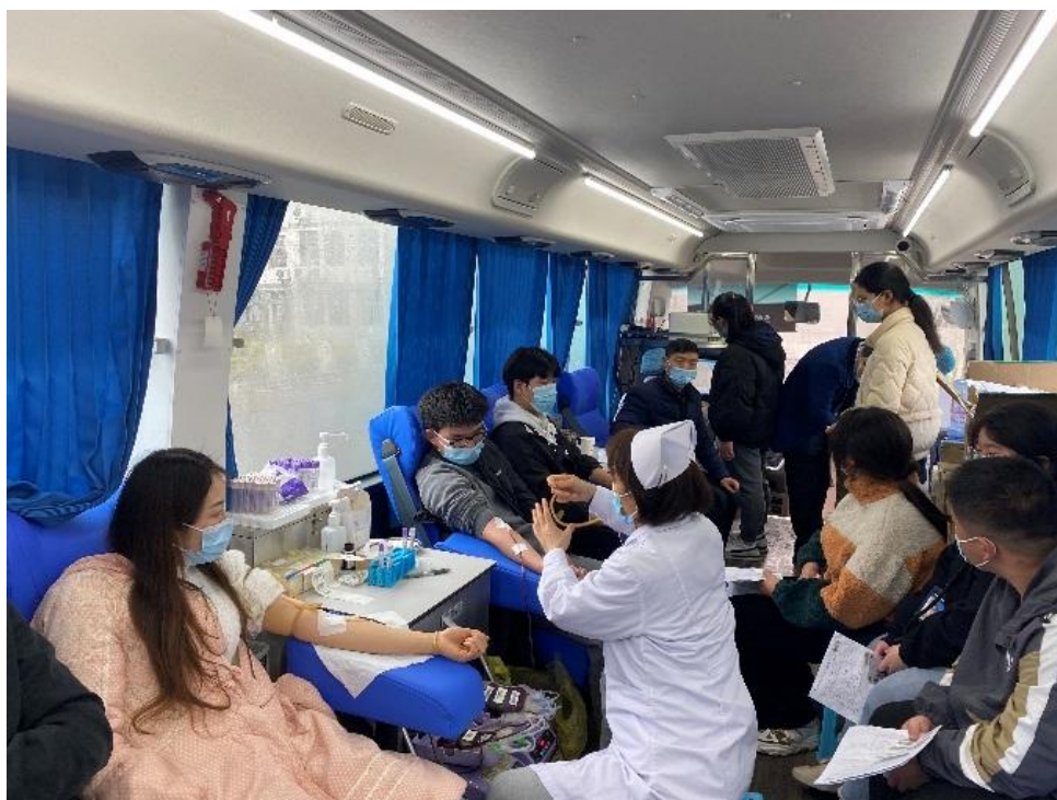
图 4 师生参与无偿献血活动

热血凝聚爱心，行动彰显担当。无偿献血不仅是一种奉献，更是一种社会责任和义务，也是为社会公益贡献一份力量。活动中踊跃的参与度，传递着满满的爱心和正能量。