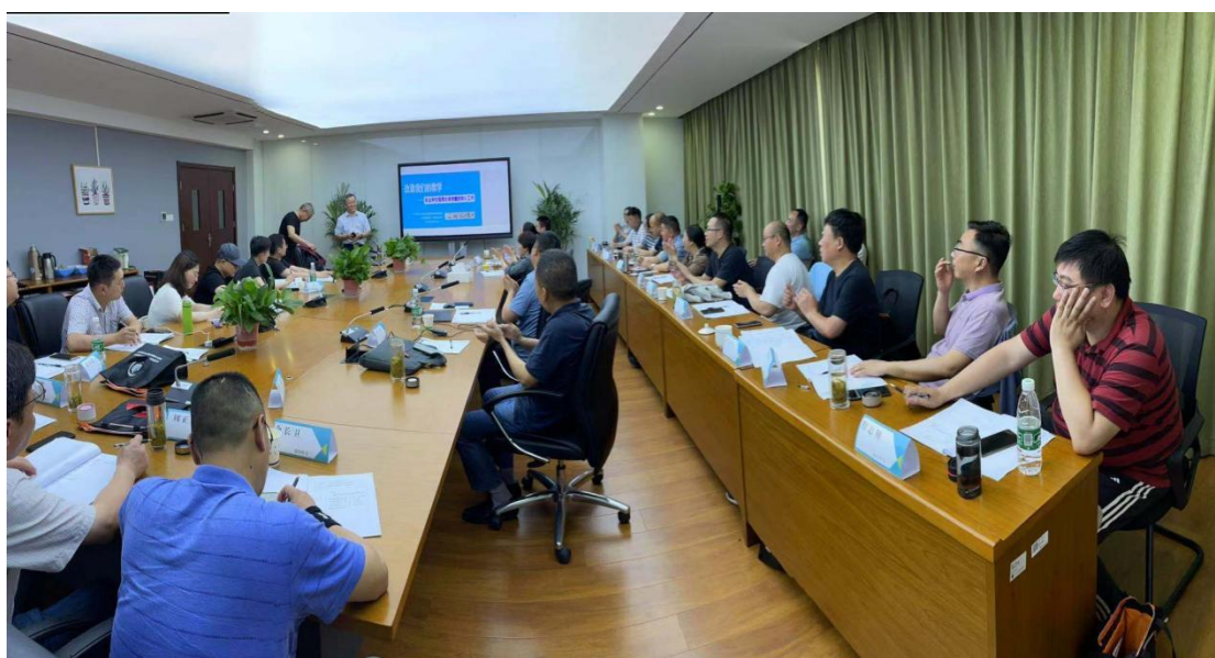
图 9 专家做“改造我们的教学”专题报告

强化立德树人导向，全面贯彻深化新时代教师队伍建设改革的总体要求，树牢教师“为党育人”“为国育才”使命意识和服务东台经济社会发展的担当意识。推进教师培训关键环节改革，2021年、2022年划拨专项经费用于行政管理人員和骨干教师能力提升培训，系统进行教师增知强技培养，形成集中理论学习和分散跟岗锻炼相结合的校本培训特色。