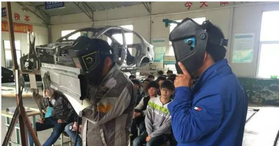
图 19 体验汽车车身修复（切割与焊接）