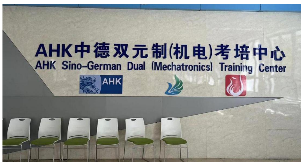
图 12 中德合作机电专业考培中心

实施“五个一批”专业调整优化行动，按照“建设一个专业（群），服务一个产业”的模式，实现产业与专业的深度融合。鼓励职业学校与企业或相关行业共同实施“订单培养”“工学交替”。学校参与东台市紧缺人才目录修订，围绕产业升级发展需求，切实增强服务地方经济的能力，提供人才支撑。每个专业群建成3个左右以产教融合为主要特色的合作项目、建成1个产业（企业）学院。校企双方按照共同制定人才培养方案、建设专业课程体系、制定专业课教学标准、开发校本教材、参与学生评价的原则全过程协同育人。充分利用“互联网+教育”平台，运用现代信息技术改进教学方式方法，推进虚拟工厂等网络教学资源应用，建设特色化、专业化职业培训平台。