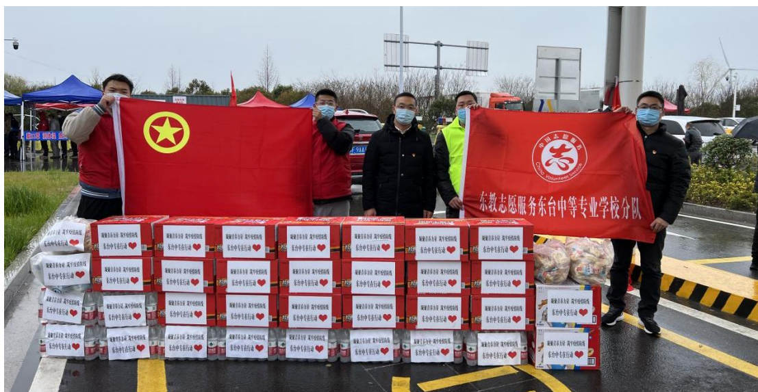
图 20 学校师生志愿者服务抗疫

近期全国多地疫情反弹，呈现点多、面广、频发的特点，处于紧要、关键时期。党有号召，团有行动。根据部署，学校团委和志愿服务分队组织广大青年教师和学生志愿者积极参与疫情防控，以青春之名，筑牢疫情防线。