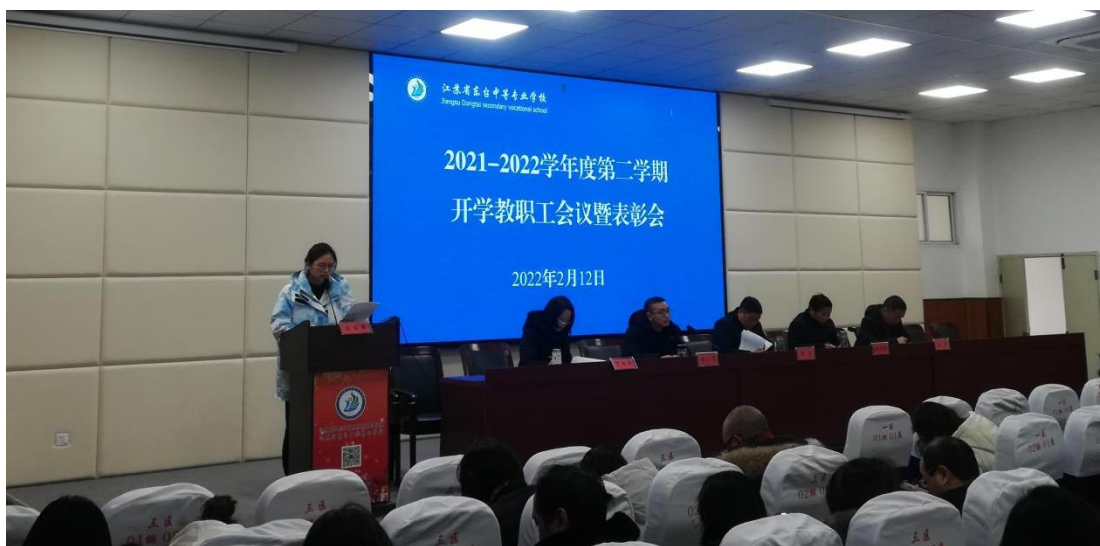
图 1 春学期开学工作暨“双先”表彰会议

生活的若干准则》以及学校相关制度，认真落实“三会一课”、民主评议党员、民主生活会和组织生活会、谈心谈话等制度，加强对执行情况的监督检查。深入推进党史学习教育常态化、制度化。贯彻落实《新时代公民道德建设实施纲要》《新时代爱国主义教育实施纲要》，激发广大干部师生爱党爱国爱社会主义热情。