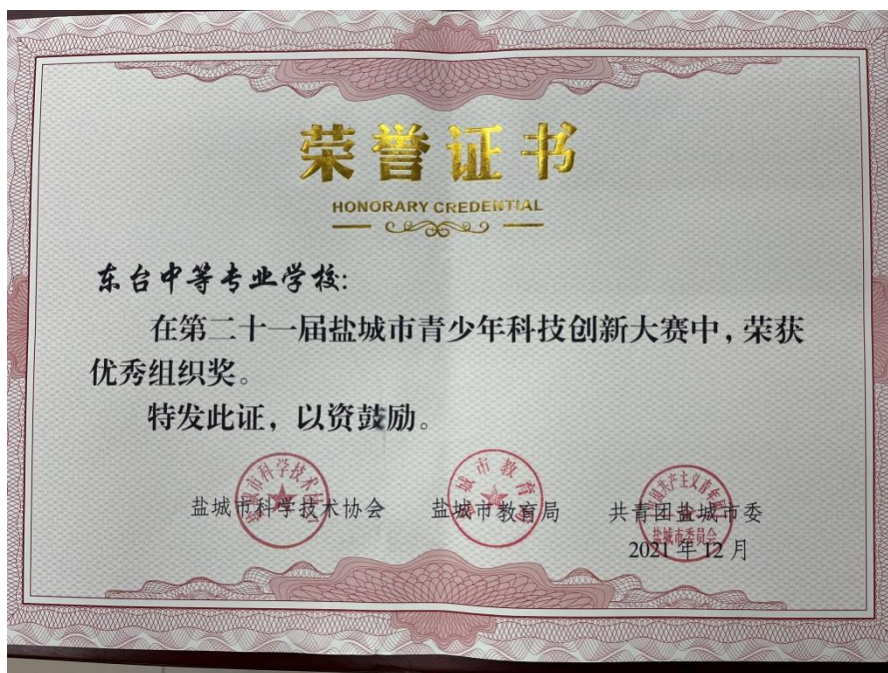
图 6 青少年科技创新大赛优秀组织奖