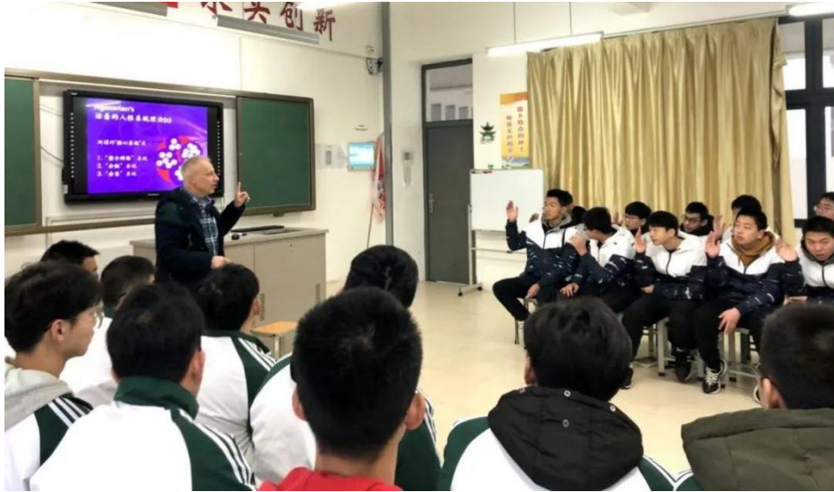
图 14 AHK 项目专家到学校现场授课