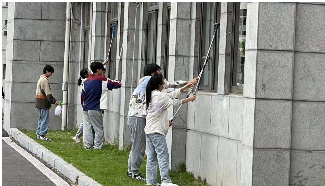
图 3 学生参加劳动实践活动

的重要性与积极意义，同时，意识到自身在用劳动服务他人的同时，也在享受着他人提供给自己的劳动成果，明白了社会的进步与发展离不开劳动，每一个人都是劳动者，更是未来世界的主人。大家决心从现在开始，从小事做起，从自身做起，用心去感受世界，用劳动去美化世界！