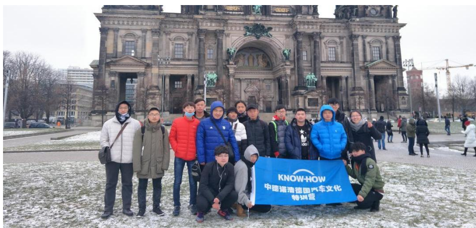
图 13 汽车维修与检测专业学生出国研学

加强合作办学，促进合作共赢。东台中专与韩国国立交通大学签约，三年制中职生和五年制高职生毕业后到韩国对口继续深造“3+2”专科、“5+2”本科，获取国际认可的学历文凭，也可以选择在韩国工作，以学分互认的培养模式为造就国际化人才打开绿色通道。