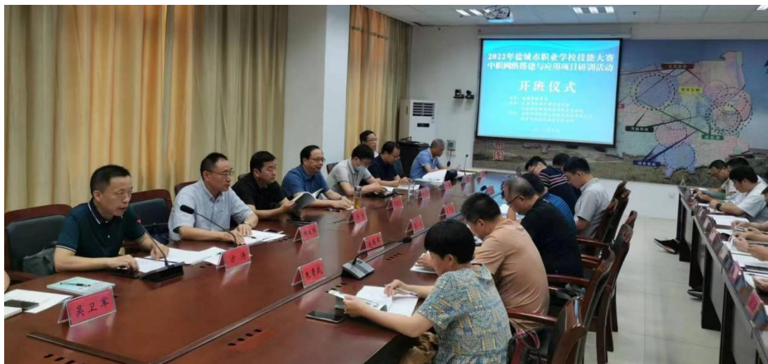
图 11 网络搭建与应用项目研训活动

校顺利开班。盐城市教育科学研究院领导、盐城市各职业学校分管校长、实训处主任以及来自盐城市内 9 所职业学校的教师二十多人参加了本次研训活动。