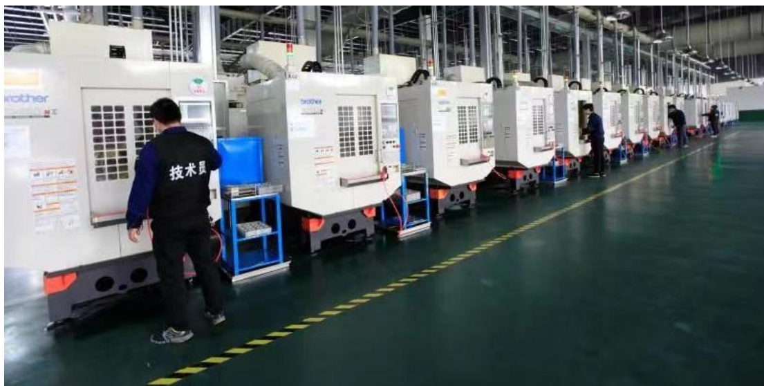
图 16 学生在企业实习