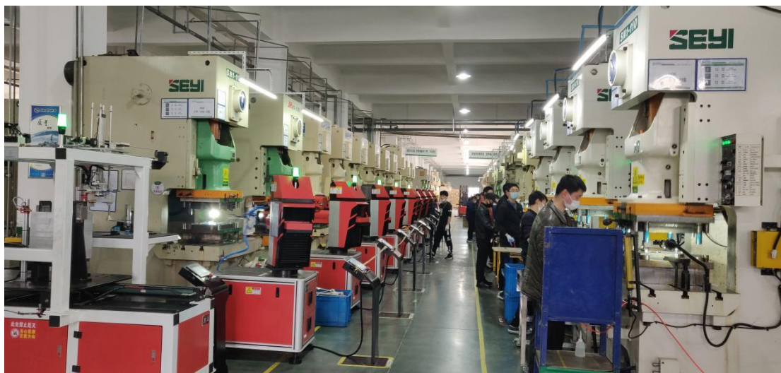
图 5 机电专业学生在市内企业实习就业

建立完善的就业服务体系。成立学校就业工作领导小组，构建一把手挂帅、分管领导具体负责、招生就业处全程指导、系部具体落实的毕业生就业工作机制，出台《学生就业工作条例》等制度，定期召开毕业生工作例会，将就业工作与系部考核挂钩。