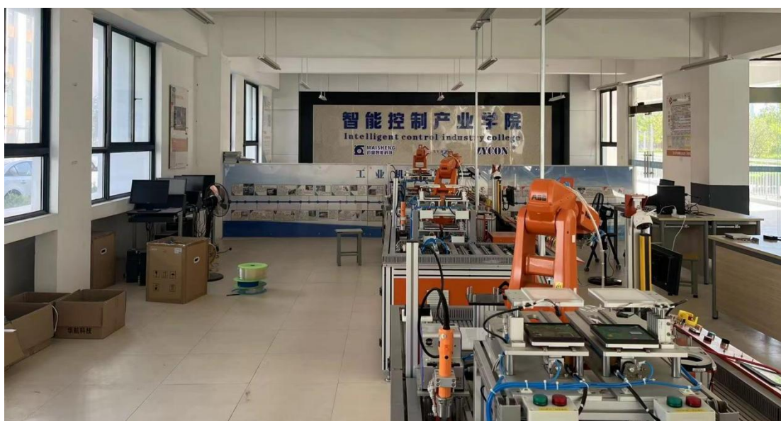
图 7 与产教融合试点企业共建产业学院