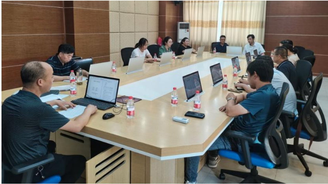
图 8 专业负责人汇报人培方案制订情况