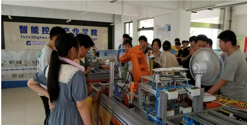
图 18 体验机器人安装调试和运行维护